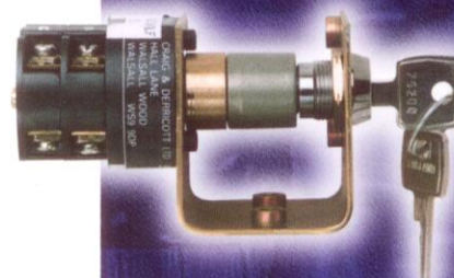
Le dispositif à contact pour clé d'annulation peut être utilisé avec: