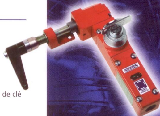
Le module pour clé de sécurité peut s'adapter sur: