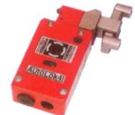
AutoLok 4, AutoStop 4