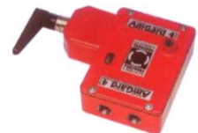
AmGard 4, AmStop 4 AmLok 4