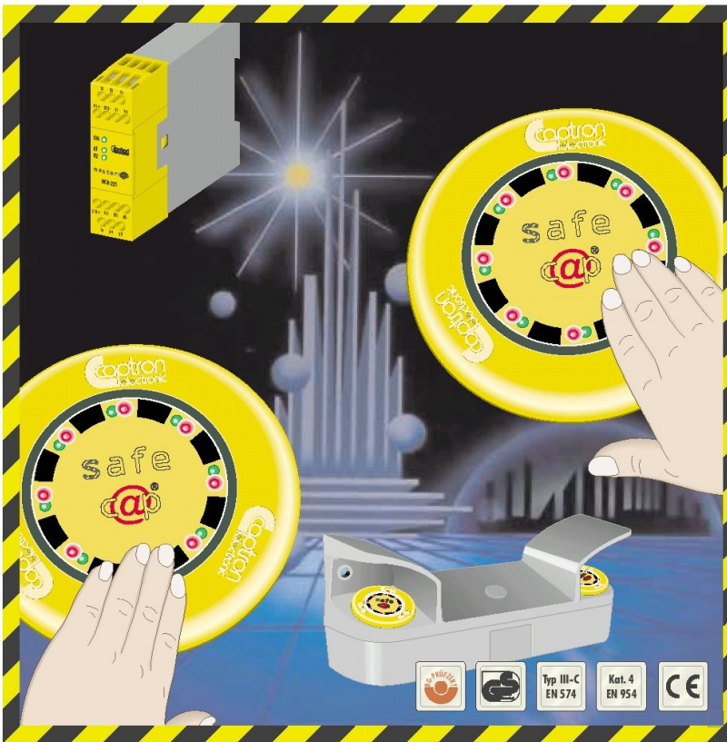
Commande bimanuelle pour presses et estampeuses