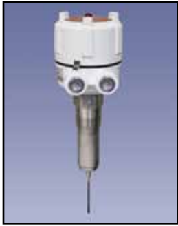
VR-21 Varilla Vibrante