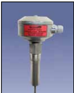
CVR-600 Varilla Vibrante

Requisitos de Energía: Una amplia gama 20-250V AC/DC Relé: El relé de SPDT, 5A @ 250 VAC (Opcional de relé DPDT está disponible) Tiempo de Retardo: 1 segundo de la parada de la vibración, 2 a 5 segundos para el inicio de las vibraciones Temperatura Ambiente: -4°F a 140°F (-20°C a +60°C) Proceso de Temperatura: A 176°F estándar (80°C); a 284°F de alta temperatura (140°C) Presión: 145 psi Caja/Cobertura: Aluminio fundido, NEMA 4, 5 y 12 Sonda: 304 Acero inoxidable, longitud de inserción 13" a 13' Montaje: 1-1/2" NPT Materiales Densidades: Desde 1.25 libra/pie cu.