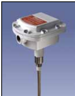
Detección de Polvo 1000 Detección de Polvo

Requisitos de Energía: 115 ó 230 VAC 50/60 Hz, 5 VA Temperatura de Funcionamiento Remoto: -22° F a 158° F (-30°C a +70°C) Temperatura de Funcionamiento de Consola: -31° F a 158° F (-35°C a +70°C) Proceso de Temperatura: 250°F (121°C) si el aire ambiente temperatura es inferior a 150°F (65°C) Rango de Detección: Hasta 10 pies Frecuencia: 24.125 GHz, menos 3 1mW/cm (Límite de OSHA es 10mW/cm 2 ) Caja Remoto: Aluminio fundido a presión Aprobaciones Remoto: En la lista de Clase II, Grupos E, F & G para lugares peligrosos Tipo de Caja/Cobertura: NEMA 4X, 5, 9 y 12 Salida: DPDT contactos secos, 5A @ 240 VAC o 30 VDC Tiempo de Retardo: Un solo turno 0.1-15 segundo