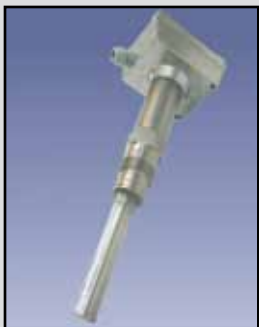
SHT-120/140 Varilla Vibrante

Requisitos de Energía: Amplia gama 20-250VAC/DC Consumo de Energía: 3 VA Relé: SPDT 5A 250 VAC Tiempo de Retardo: 1 segundo de detenerse la vibración, 2 a 5 segundos para el inicio de las vibraciones Temperatura ambiente: -4°F a 150°F (-40°C a +65°C) Proceso de Temperatura: A 176°F estándar (80°C); a 300°F de alta temperatura (150°C) Presión: 145 psi Cableado del cable: 1/2" Montaje: 1" NPT Caja/Cobertura: Aluminio fundido, NEMA 4, 5 y 12 Sonda: 304 acero inoxidable, 6" longitud de inserción La Densidad del Material: De 3.5 libras/pie cu.