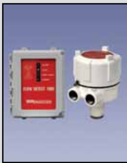
Detección de Flujo 1000 Detección de Flujo por Microondas

Aplicaciones Preferidas: Polvos y sólidos Rango de Medición: 200 pies (61 metros) Voltaje de la Fuente: 20 a 32 VDC Temperatura de Proceso: -40°F a 185°F (-40°C a 85°C) Presión del Proceso: -2.9 a 14.5 PSI Señal de Salida: 4-cables 4-20mA/HART /RS-485/Modbus Emite Frecuencia de: 3 KHz a 10 KHz Caja/Cobertura: Molde en polvo de aluminio fundido a presión