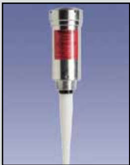
SmartWave Transmisor de Radar de Pulso

Requisitos de Energía: Las unidades de CA (corriente alterna) de 115 VAC 60 Hz o 230 VAC 50 Hz, unidades de DC 12 a 30 VDC 0.07 Amperios Temperatura Ambiente: -40°F a 140°F (-40°C a + 60°C) Proceso de Temperatura: Hasta 200° F (93°C) Operación: Ultrasonidos Frecuencia: 25 a 148 KHz Rango de Medición de Líquidos: 90' máxima Gama de la Medida de Sólidos: 40' máxima Precisión: ± 0.25% Ángulo de Haz: 6° - 12° cónica a-3dB Compensación de Temperatura: Continua en transductor Salida: 4-20 mA y RS-485 Montaje: 3" NPT Caja/Cobertura: PVC-94VO Aprobaciones y Certificaciones: NEMA 4X (IP65)