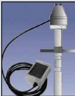
PRO HTRC-20 Sensor de Capacidad

Requisitos de Energía: 115, 230 VAC o 24 VDC Salida de Relé: SPDT 5 amperios a 250 VAC Temperatura Ambiente: -40°F a 185°F (-40°C a +85°C) Temperatura del Proceso: Hasta 240°F (116°C) Presión: 150 PSI Aprobaciones y Certificaciones: NEMA 4X, 5 y 12 Caja o Cobertura: PVC Sonda: CPVC Montaje: 1" NPS (1-1/4" adaptador disponible) LED: Indica la presencia o ausencia de material