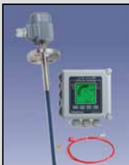
BM-30 LGX Monitoreo de Partículas

Requisitos de Alimentación: 115 VAC, 50/60 Hz ± 15%, 5 VA, 230 VCA opcional Salida de Relé: Dos SPDT 10 Amp (Alerta y alarma) Temperatura Ambiente: -25° F a 160°F (-32°C a +71°C) Proceso de Temperatura: Hasta 250°F (121°C) Presión: 500 PSI Cobertura/Caja de Protección: De aluminio fundido, acabado en polvo aprobado por USDA Montaje: 1-1/4" NPT o 3 / 4" NPT 316 SS Estándar: 1-1/4" NPT en acero inoxidable 316 y reborde sanitarios opcionales Alarma: Alarma dual (2x alarma es pre-alarma) seleccionables a instantáneo o un promedio de un minuto Sensibilidad: 1mg/m (.0005 gr/scf)