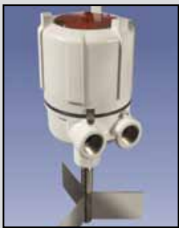
MAXIMA+ Indicador Rotativo

Requisitos de Energía: 24/115/230 VAC, 50/60 Hz, 24/12 mA VCC, 60/35 Contactos de Salida: DPDT de 10 amperios, 250 VAC Temperatura Ambiente de Funcionamiento: -40°F a +185°F (-40°C a +85°C) Proceso de Temperatura: Hasta +400°F (204°C) Presión: 1/2 micrones, 30 PSI Aprobaciones y Certificaciones: CSA/US Clase I, Grupos C y D y Clase II, Grupos E, F y G Ex II 2G 1D Ex d IIB T5 Ex tD A20 IP66 T93C (Ta = -20C to +85C) Tipo de Cobertura/Caja: NEMA 4X, 5, 7, 9 y 12 Caja: Aluminio fundido, aprobada por el USDA en acabado en polvo capa Montaje: 1-1/4 "NPT Conexiones de los Conductos: 3/4 "NPT Eje y Componentes: Acero inoxidable