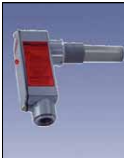
Compact PRO Sensor de Capacidad

Requisitos de Energía: 115/230 VAC, 50/60 Hz \pm 15%, 5 VA Salida de Relé: DPDT de 10 amperios a 250 VAC Temperatura Ambiente: -40°F a 185°F (-40°C a +85°C) Proceso de Temperatura: A 250°F sonda Delrin al descubierto (121°C); a 500°F sonda de Teflón (260°C) Presión: 500 PSI Aprobaciones y Certificaciones: En la lista de Clase II, Los Grupos E, F y G para lugares peligrosos Tipo de Caja o Cobertura: NEMA 4X, 5, 9 y 12 Caja de Protección: Aluminio fundido, aprobada por el USDA en acabado en polvo Montaje: 1-1/4" NPT o 3/4" NPT estándar de acero inoxidable, 1-1/4" NPT en acero inoxidable 316 y reborde sanitario