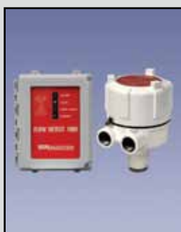
Detección de Flujo 1000 Detección de Flujo por Microondas

Aplicaciones Preferidas: Polvos y sólidos Rango de Medición: 200 pies (61 metros) Voltaje de la Fuente: 20 a 32 VDC Temperatura de Proceso: -40°F a 185°F (-40°C a 85°C) Presión del Proceso: -2.9 a 14.5 PSI Señal de Salida: 4-cables 4-20mA/HART /RS-485/Modbus Emite Frecuencia de: 3 KHz a 10 KHz Caja/Cobertura: Molde en polvo de aluminio fundido a presión