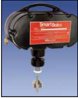
SmartBob2 Sensor Cable-Basado