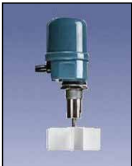
Mini Indicador Rotativo

Requisitos de Energía: 24/115/230 VAC, 50/60 Hz, 12/24 VDC mA, 60/35 Salida de Relé: DPDT de 10 amperios, 250 VAC Indicador de Estado de Relé: SPDT de 10 amperios, 250 VAC (relé de estado sólido opcional) Temperatura Ambiente de Funcionamiento: -40°F a 185°F (-40°C a +85°C) Proceso Temperatura: Hasta +400°F (204°C) Presión: 1/2 micrones, 30 PSI Aprobaciones y Certificaciones: CSA para la Clase II, Grupos E, F, G Ex II 1D Ex tD A20 IP66 T93C (Ta = -20C to +85C) Tipo de Cobertura/Caja: NEMA 4X, 5, 9 & 12 Caja: Aluminio fundido, aprobado por la USDA en acabado en polvo de capa Montaje: 1-1/4 "NPT Conexión de los Conductos: 3/4 "NPT Eje y Componentes: Acero inoxidable