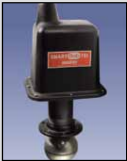
SmartBob - TS1 Sensor Cable-Basado

Requisitos de Energía: 115/230 VAC 50/60 Hz Temperatura Ambiente: -40°F a 185°F (-40°C a +85°C) Proceso de Temperatura: Hasta 500°F (260°C) Rango de Medición: Hasta 180 pies Velocidad de Medición: 2 metros por segundo Precisión: ± 0.25% desvincúlese certeza demedida Montaje: 3" - 8" NPT Caja/Cobertura: Molde de policarbonato Aprobaciones y Certificaciones: En la lista de Clase II, Grupos E, F y G para lugares peligrosos Tipo de Caja: NEMA 4X, 5, 9 y 12