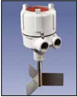
BMRX Indicador Rotativo