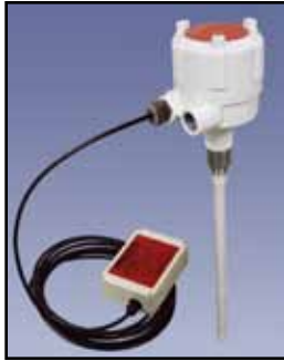
PRO REMOTE Sensor de Capacidad