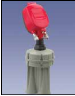
3DLevelScanner Sensor Sin-Contacto