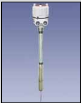
VR-41 Varilla Vibrante

Requisitos de Energía: Una amplia gama 20-250V AC/DC Relé: El relé de SPDT, 5A @ 250 VAC (Opcional de relé DPDT está disponible) Tiempo de Retardo: 1 segundo de la parada de la vibración, 2 a 5 segundos para el inicio de las vibraciones Temperatura Ambiente: -4°F a 140°F (-20°C a +60°C) Proceso de Temperatura: A 176°F estándar (80°C); a 284°F de alta temperatura (140°C) Presión: 145 PSI Caja o Cobertura: Aluminio fundido, tipo NEMA 4, 5 y 12 Sonda: 304 de acero inoxidable 304, longitud de inserción 7.37" Montaje: 1-1/2" NPT Densidades del Material: Desde 1.25 libras/pie cu.