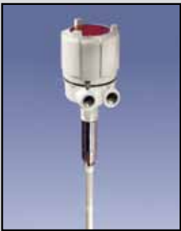
PROCAP IX & IIX Sensor de Capacidad

PROCAP I Requisitos de Energía: Fuente universal de alimentación 24 a 240 VAC/VDC PROCAP II Requisitos de Energía: Seleccionable 115/230 VAC Salida de Relé: DPDT de 10 amperios a 250 VAC Temperatura Ambiente: -40°F a 185°F (-40°C a +85°C) Proceso de Temperatura: A 250°F Delrin/sonda al descubierto (121°C); a 500°F sonda de Teflón (260°C) Presión: 500 PSI Aprobaciones y Certificaciones: En la lista de Clase II, Los Grupos E, F y G para lugares peligrosos Tipo de Caja o Cobertura: NEMA 4X, 5, 9 y 12 Caja de Protección: Aluminio fundido, Aprobada por el USDA en polvo capa de acabado Montaje: 1-1/4" NPT o 3/4" NPT 316 SS estándar; 1-1/4" NPT 316 SS & reborde sanitario opcional