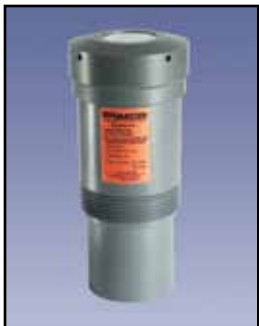
SmartSonic Transmisor Ultrasónico

Requisitos de Energía: 115/230 VAC 50/60 Hz Temperatura Ambiente: -20°F a 140°F (-29°C a + 60°C) Proceso Temperatura: Hasta 140°F (60°C) Rango de Medición: 40 pies Frecuencia de Mediciones: 1 pie por segundo Precisión: ± 0.25% desvincúlese certeza demedida Montaje: Especial sobre el perno o 3" - 6" NPT Caja/Cobertura: Rotacional de polietileno moldeado Aprobaciones y Certificaciones: NEMA 4X (IP65)